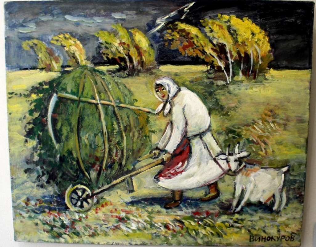
Винокуров В.С. 1949 Гроза 2014 Гипс, масло Victor S. Vinokurov 1949 Thunderstorm 2014 Gypsum, oil